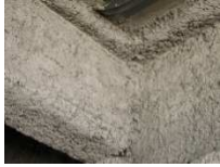
Liste A : Flocages, calorifugeages, faux-plafonds

Les objets soumis aux analyses doivent être issus de sondages de matériaux des listes A (article R 1334-20), liste B (article R. 1334-21) et liste C (article R. 1334-22) également reprises dans la norme NF X 46-020 – Août 2017.