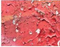
Liste B : Matériaux accessibles sans travaux destructifs