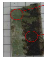
Couche 1 : matériau souple de type dalle de sol (vert) Couche 2 : Matériau de type colle bitumineuse (noire), matériau de type colle jaune