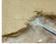
Liste C : Matériaux incorporés ou faisant indissociablement corps avec l'immeuble

En aucun cas, le client ne peut transmettre des mélanges de produits ou de matériaux manufacturés pour lesquels l'homogénéité de l'échantillon n'est pas garantie, mettant en jeu directement la fiabilité de l'analyse.